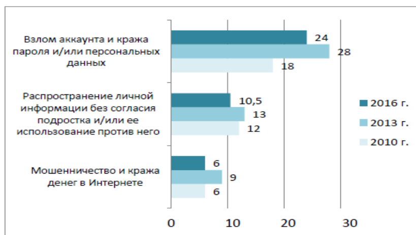
Рис. 1. Ответы подростков на вопрос: «Случалось ли что-либо из перечисленного с тобой в Интернете в течение последних 12 месяцев?», %

Исследование отношения российских подростков к приватности и персональным данным, которое проводилось в начале 2016 г. Общая выборка составила 320 подростков в возрасте 11–17 лет (130 мальчиков – 40,6% и 190 девочек – 59,4%), обучающихся в образовательных учреждениях Москвы и Московской области. Исследовались: уровень подверженности школьников рискам, возникающим вследствие неосторожного обращения с персональными данными; представления школьников об уровне конфиденциальности и публичности различных категорий информации; фактический уровень доступа к тем или иным видам данных подростков в социальных сетях; готовность ребят делиться личной информацией с другими пользователями, а также круг лиц, к которым подростки обращаются за помощью с настройками приватности в Сети.